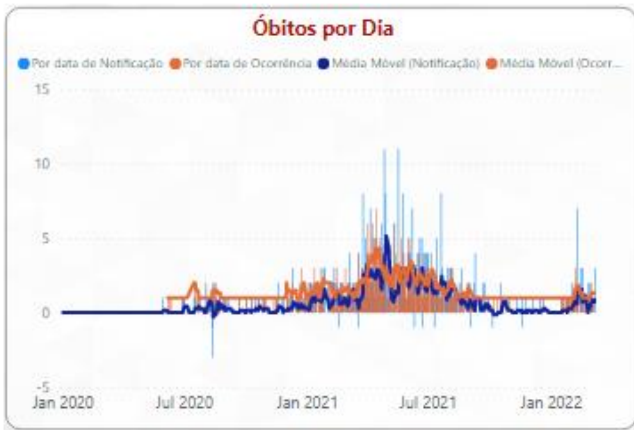
Gráfico 2 - Média Móvel de óbitos por COVID-19 segundo data de ocorrência, Macrorregião de Saúde Jequitinhonha, 2020, 2021 e 2022.