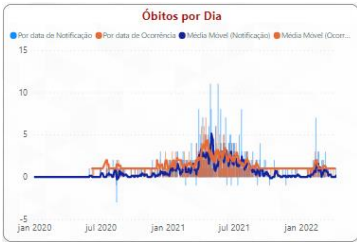
Gráfico 2 - Média Móvel de óbitos por COVID-19 segundo data de ocorrência, Macrorregião de Saúde Jequitinhonha, 2020, 2021 e 2022.