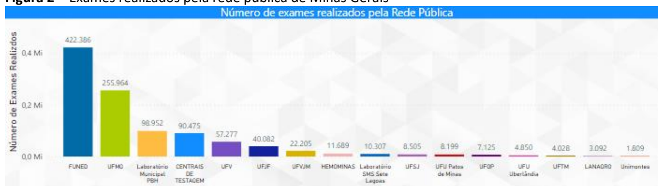
Figura 2 - Exames realizados pela rede pública de Minas Gerais

Dados sujeitos a atualização mensal. Atualizado em 14/02/2022. Os quantitativos realizado pelo Instituto René Rachou estão contabilizados como FUNED. Além da realização do exame RT-PCR (fase analítica), a FUNED realiza a fase pré-analítica (recebimento, triagem e preparo) de até 2.550 amostras encaminhadas para a UFMG semanalmente.