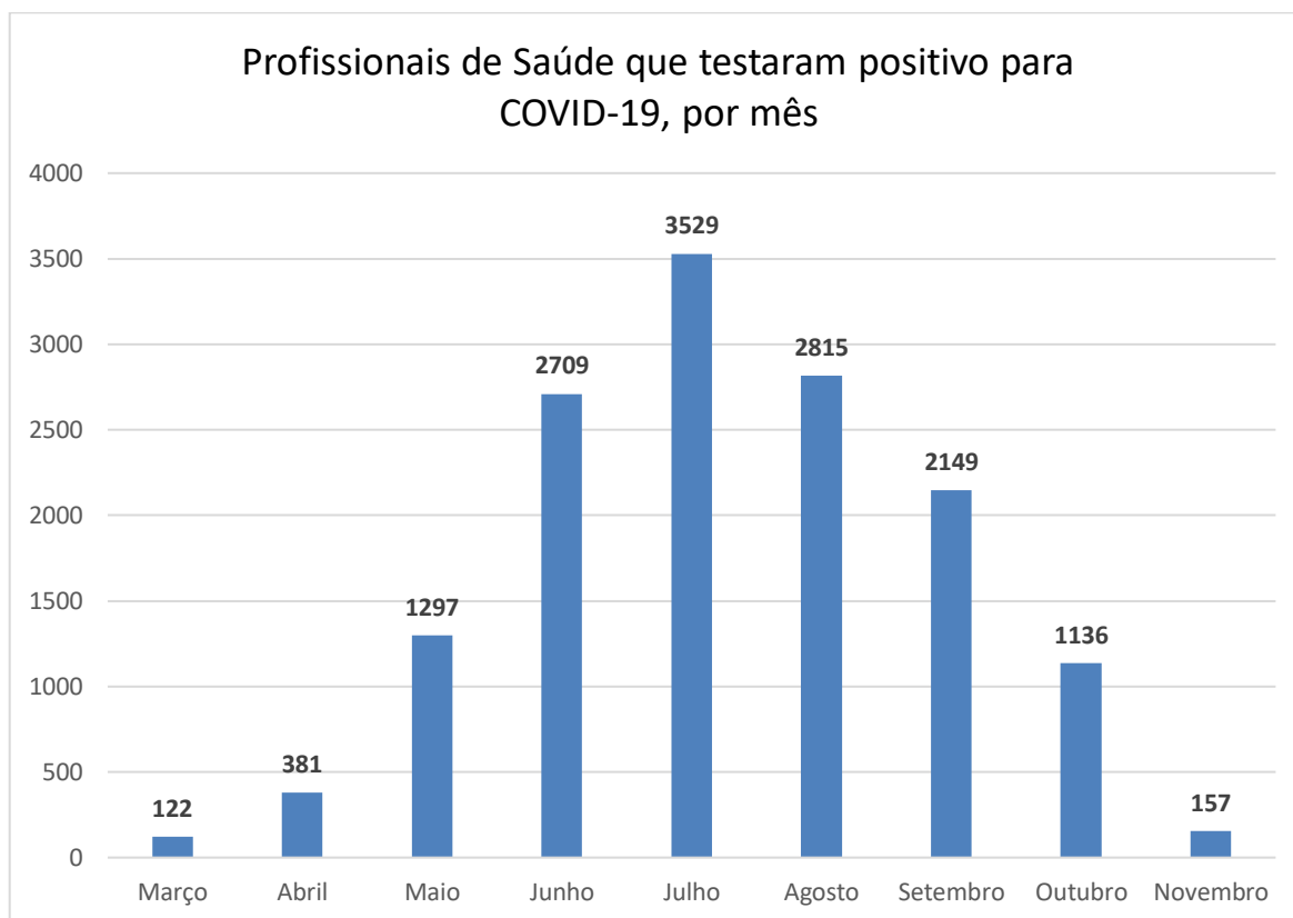
Figura 4. Número de profissionais de saúde que testaram positivo para COVID-19, por mês*.

Fonte: e-SUS ve. SIVEP-Gripe, resultados de Laboratórios Privados e Farmácias Privadas, CIEVS. Dados de 09/03/2020 a 16/11/2020.